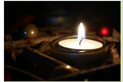
Die Hebamme Gottes

Sigg, Stephan: Lenas supercooles Klimaretter-Mitmachbuch, illustriert von Anna-Katharina Stahl, Verlag camino 2022. Zur Leseprobe: https://bit.ly/3UwEmn2