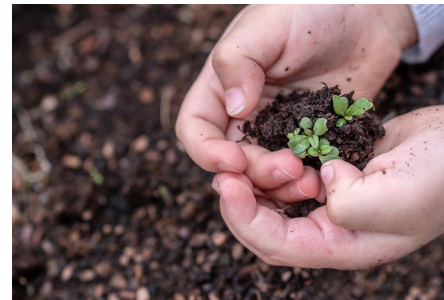
DigiPool der Schulbuchreihe „Zeit für Religion“

Das Team der Fortbildung Religion an der PPH Augustinum freut sich über Ihr Interesse und Ihre Anmeldung!