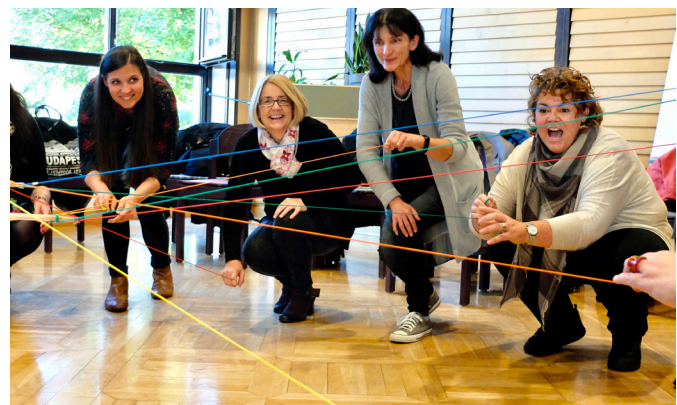
ARGE Leiter*innen Tag 2022

Wohlbefindens von Schüler*innen. Der Religionsunterricht leistet dabei einen wesentlichen Beitrag zur Förderung und Aktivierung derselben durch gemeinschaftsstiftende Erfahrungen, durch eine gelebte Feierkultur oder die inhaltliche Vermittlung von sozialen und emotionalen Kompetenzen.