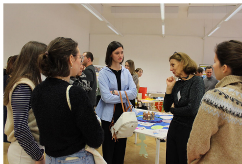
Impressionen vom Open House 2024

Bis Mitte Mai haben Interessierte an einem Lehramtsstudium an der PPH Augustinum die Möglichkeit, an zehn Dienstagen, jeweils um 18.00 Uhr an einer Online-Studieninformation teilzunehmen. Die Studienmöglichkeiten im Bereich der Religionspädagogik werden am 19. März und 07. Mai 2024 näher vorgestellt. Zudem bieten Studierende der PPH Augustinum ein Diskussionsforum für zukünftige Studierende an.