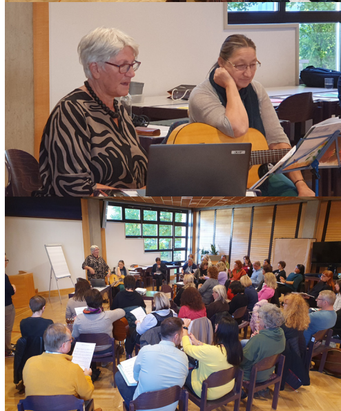
Impressionen vom ARGE Leiter*innen Tag 2023